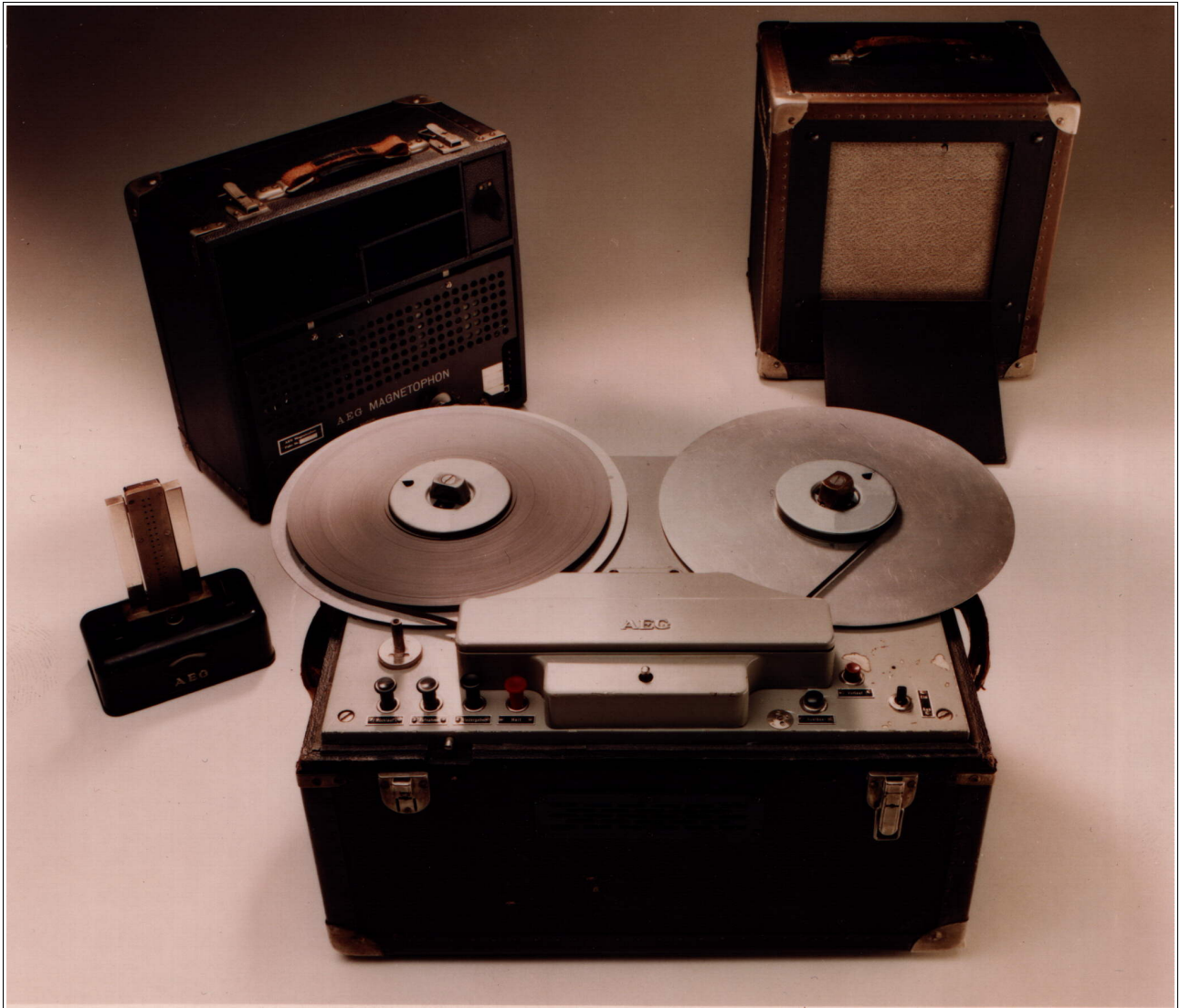
AEG 'Magnetophon' 1935