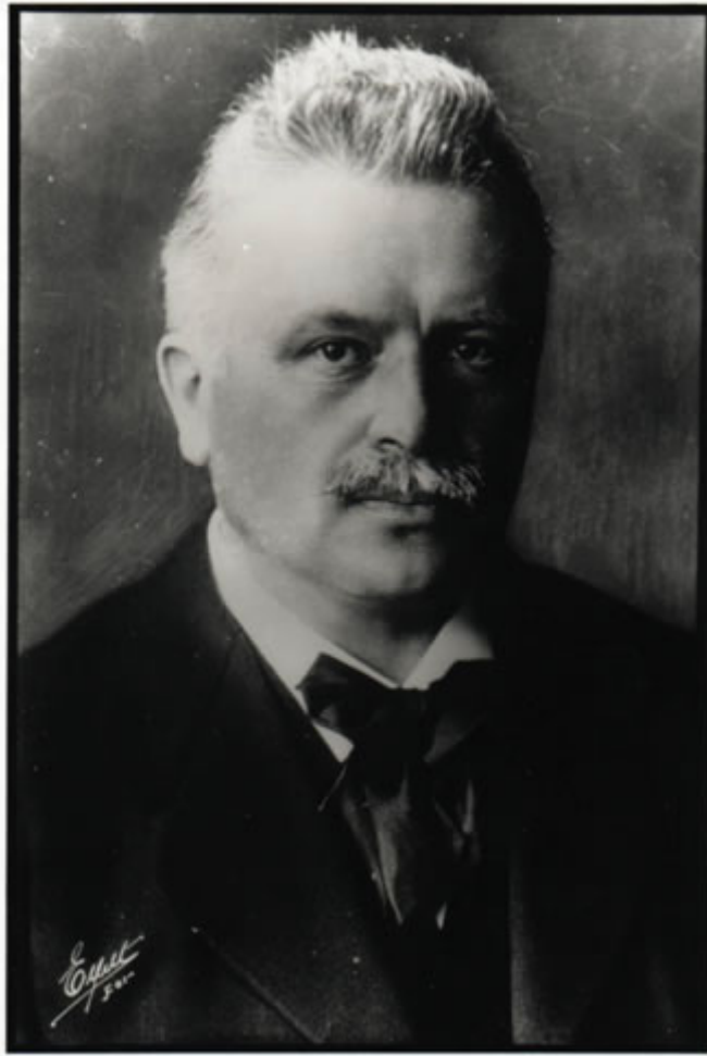
Valdemar Poulsen (1869-1942)