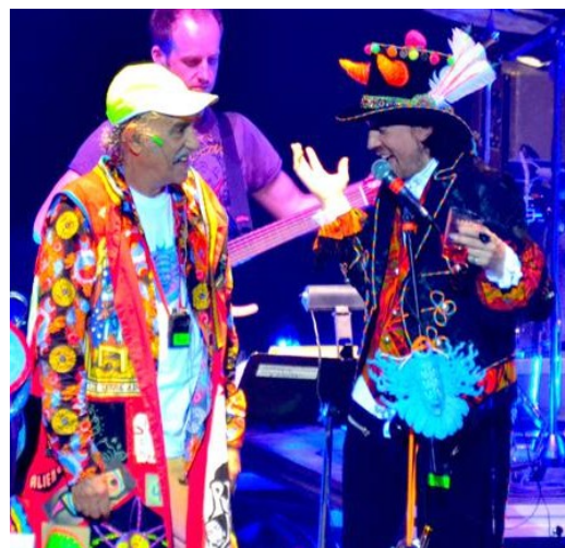
Shpongle live, New York 2011

Shpongles debut-album Are You Shpongled? udkom 1998 og anses af mange for at være med til at stifte Psybient-genren (sammentrækning af psychedelic og ambient ). [27]