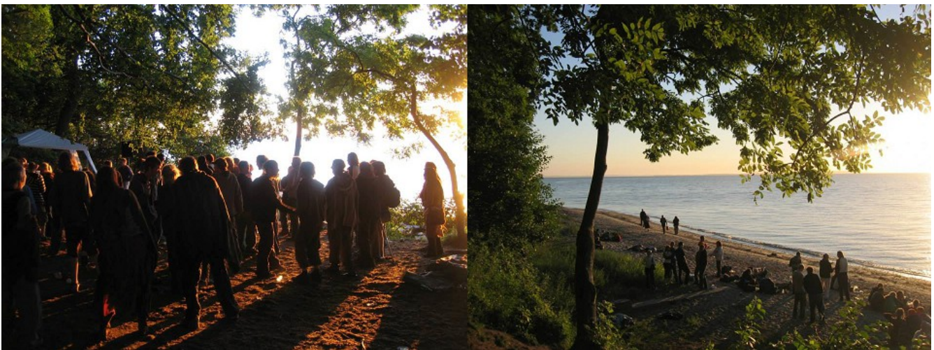
'Skovfest' i Moesgård skov, Århus

I Danmark, særligt Moesgård ved Århus, blev Darkpsy -musikken spillet, primært af de labels og kunstnere som komponerede musikken, til såkaldte 'skovfester' hvor den blev dyrket for sin transformative virkning i nattens mørke, hvor den ledsaget af psykedeliske rusmidler sender deltagerne på dansegulvet på en rejse indtil solopgangen, typisk i forbindelse med stoffets aftagende virkning, giver en følelse af åndelig genfødsel, hvilket er et klassisk træk i alle shamanistiske retninger, et ekstatiske ritual som giver shamanen en død/genfødselsoplevelse. [32]