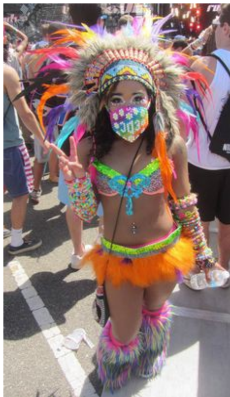
Kvindelig raver iklædt et 'neo-tribal outfit'

En af de offentlige personer som blev talsmand for "bevægelsen" var filosof, etnofarmakolog og historiker Terence McKenna som havde tilbragt 30 år i amazon-junglen blandt indfødte shamanistiske kulturer hvor han studerede deres brug af psykotropiske og helbredende planter og mixturer. Han holdt, indtil sin død i 2000, taler rundt omkring i hele verden om integreringen af de shamanistiske værdier i d. 21. århundrede.