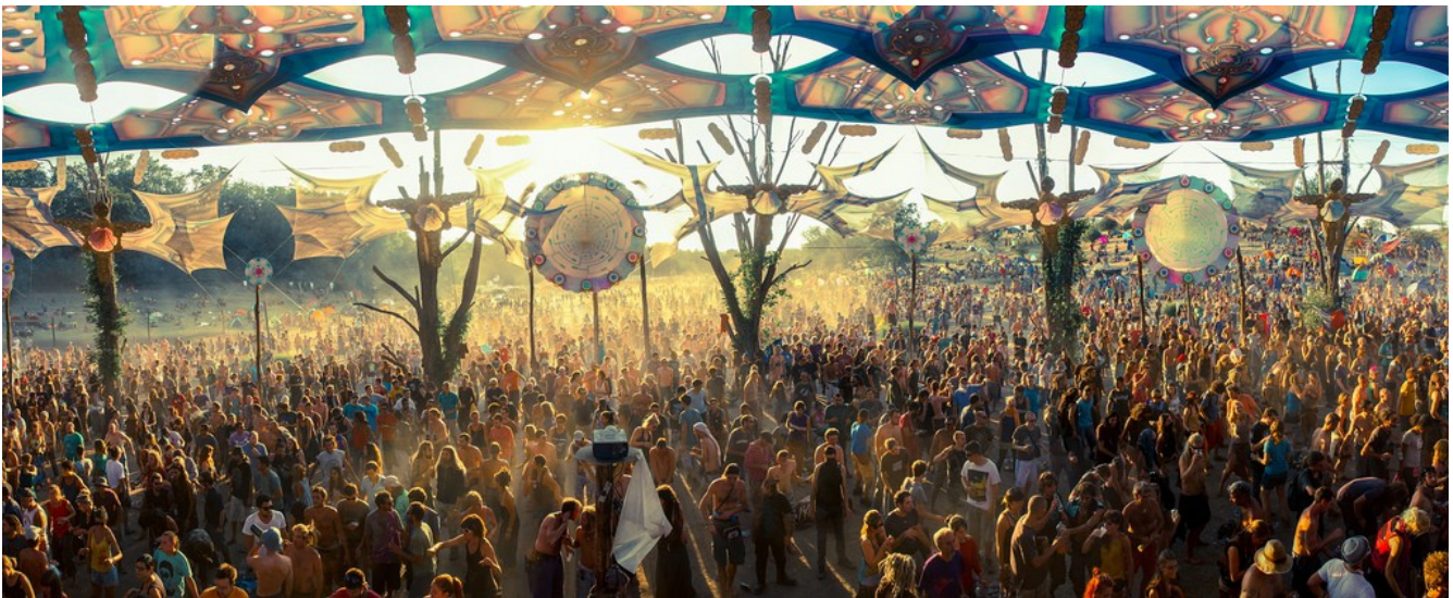
'O.Z.O.R.A. Festival 2014'

“Hvad den arkæiske genopblomstring [eng.: The Archaic Revival] står for er shamanisme, ekstase, orgiastisk seksualitet og besejringen af folkets tre største fjender: hegemoni, monogami og monotoni! Det er en oplevelse af det levende faktum af planetens formål. Og uden den oplevelse vandrer vi i ørkenen af falske idéer. Men med den oplevelse kan selvets kompas stilles og det er selve idéen; at regne ud hvordan selvets kompas kan stilles gennem fællesskab, gennem ekstatisk dans, gennem psykedelika, seksualitet, intelligens, intelligens! Dette er hvad vi behøver for at kunne flygte fremad mod 'hyperspace'.” [37]